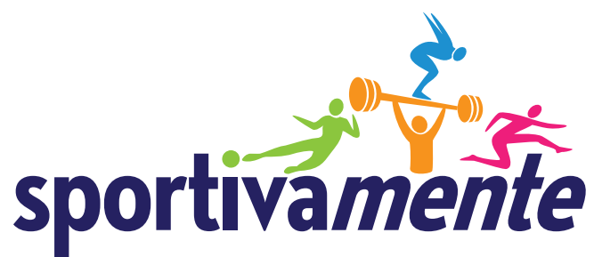
ESEMPIO D'USO SU FONDO BIANCO