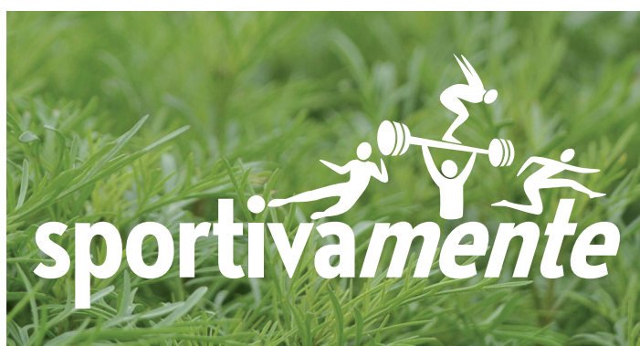
ESEMPIO D'USO SU IMMAGINE