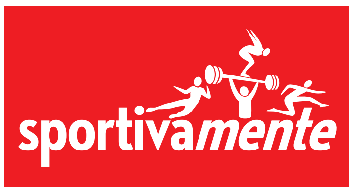
ESEMPIO D'USO SU FONDO COLORATO